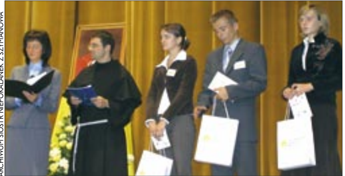
ARCHIWUM SIÓSTR NIEPOKALANEK Z SZYMANOWA

Pierwszy finał był częścią obchodów dnia papieskiego i od-